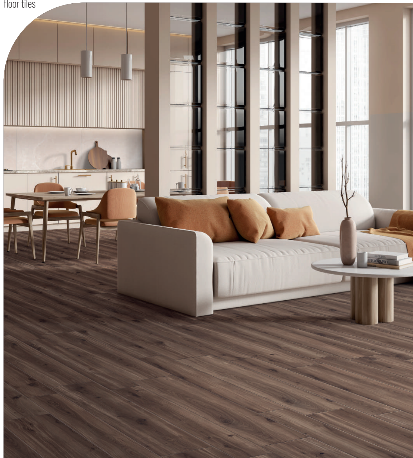
VIVO ROVERE NOCE SCURO 20,2x121,9 | 30,4x121,9