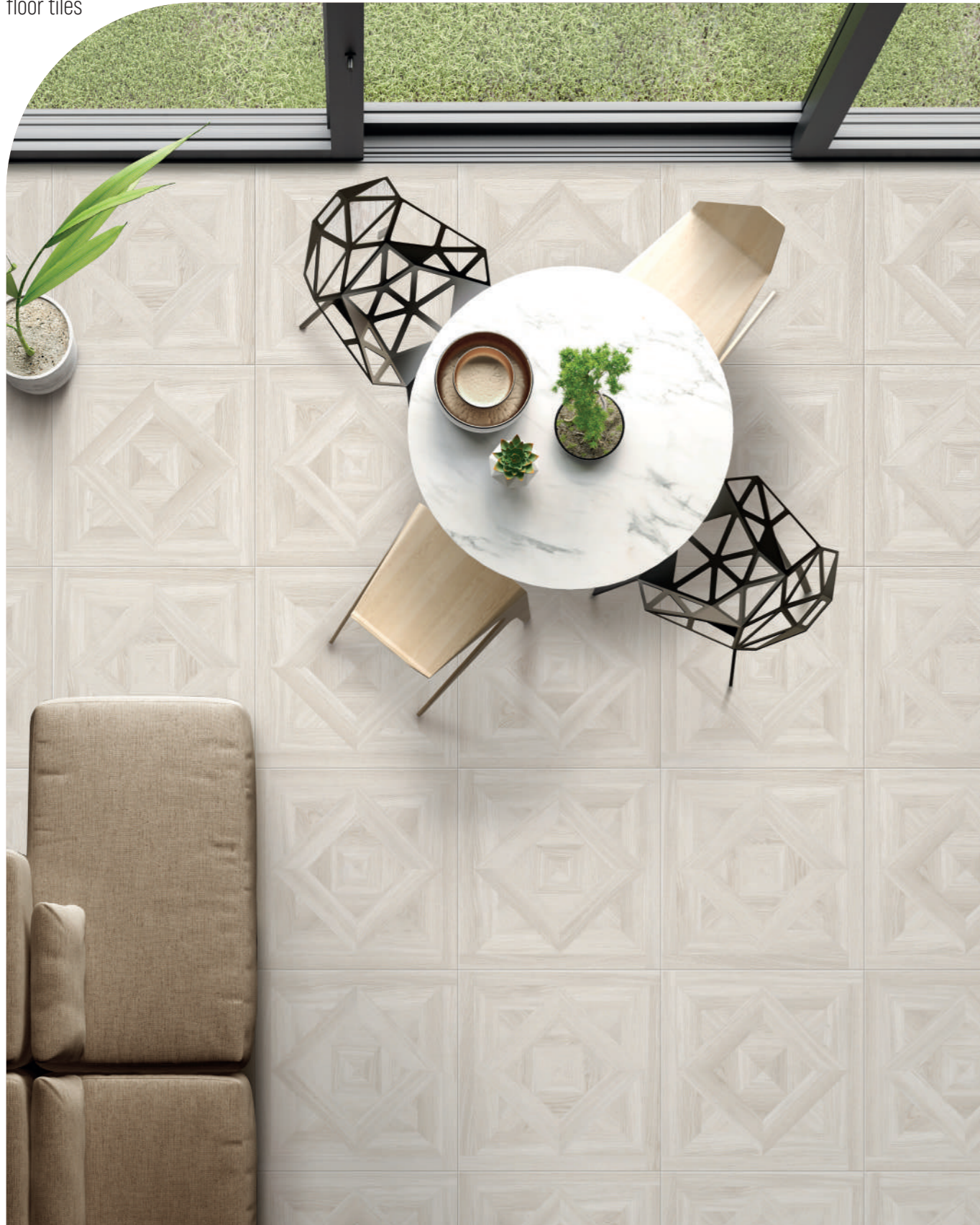
VIVO ROVERE INTARSIO SBIANCATO 61x61